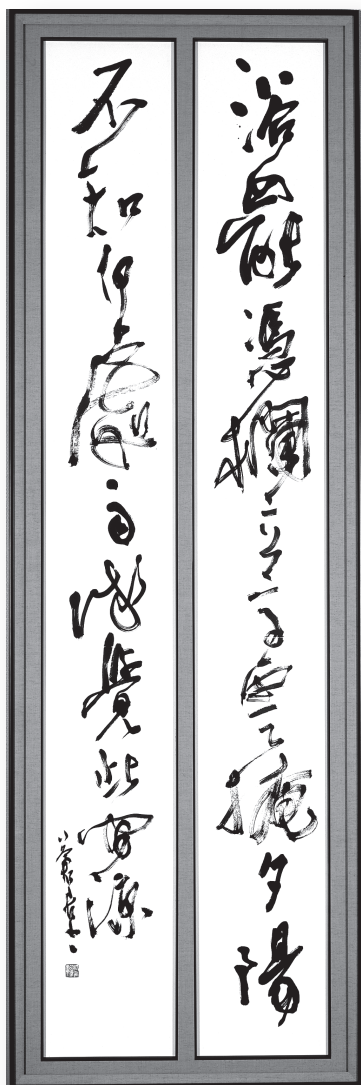
二〇〇六年 日本藝術院賞